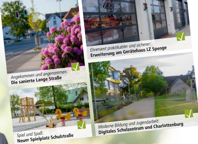
Angekommen und angenommen: Die sanierte Lange Straße