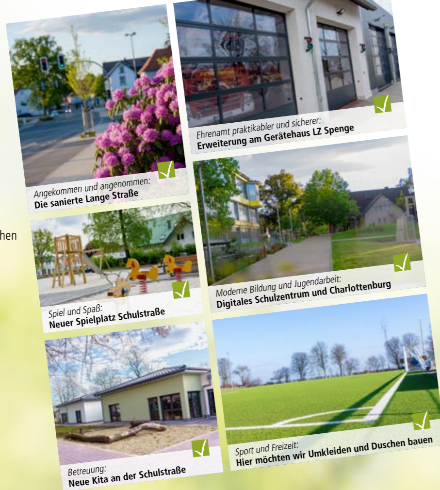
Angekommen und angenommen: Die sanierte Lange Straße

Alle in 2014 formulierten Ziele sind erreicht!